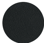
Electroestática en polvo Mate