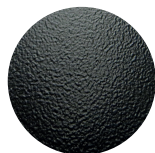
Electroestática en polvo Glossy